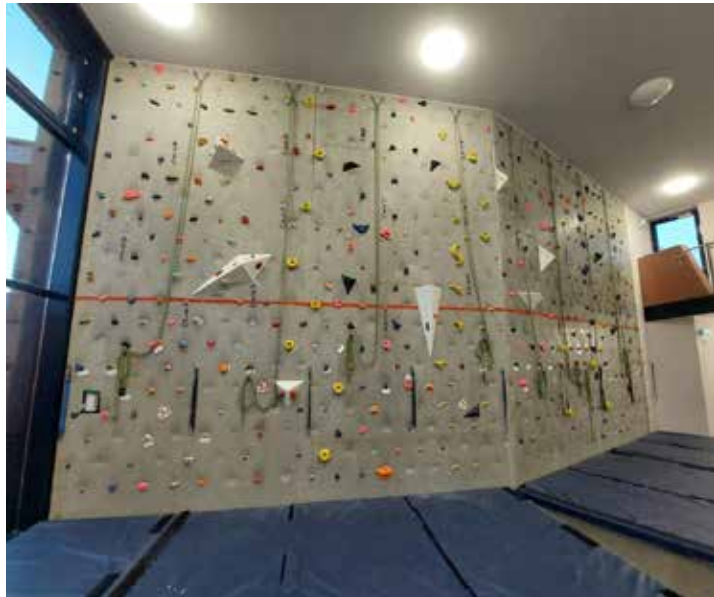
Aktueller Zustand der Kletterwand

Die Besprechung anlässlich dieses Termins führte zu dem Ergebnis, dass der Umbau auch unter Berücksichtigung aller Brandschutzregelungen realisierbar ist. Für den Umbau ist ein Bauantrag in-