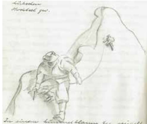
Erstbesteigung des falschen 4.000er 1944!

Strecke: ca. 22 km Gehzeit: ca. 5,5 Std. zzgl Pausen Treffpunkt: 9.10 Uhr Parkplatz Mauseloch 9.30 Abfahrt ZOB Bus 860 Startpunkt: 10.30 Bushaltestelle Klinckenberg, 24852 Eggebek Weg: Mittelschwere Wanderung auf befestigten und unbefestigten Wegen, teilweise wegloses Gelände (T1) Mitfahrkosten: ÖPNV-Ticket, anteilig Tourenleitung: Kai Vermehren, 0151 61473787