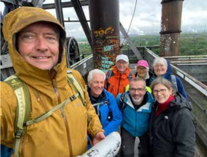
Bei nasser Witterung kletterte dieses Septett auf die höchste Ebene des Hochofens in Duisburg

Zum dritten Mal reiste im Mai 2026 eine Gruppe Flensburger DAV-Mitglieder nach Oberhausen ins Ruhrgebiet. Ziel war die große Ausstellung „Mythos Wald“ im Gasometer, die bereits wenige Wochen nach der Eröffnung mehr als 100.000 Besucher anzog. Nach dem Einchecken im Hotel nahe des Gasometers stand eine kurze Wanderung am Rhein-Herne-Kanal und durch ehemalige Werkssiedlungen der Gute-Hoffnungs-Hütte auf dem Programm.