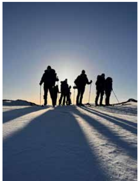
Platz 3: Backcountry Ski in Norwege, Linus Riedel

Platz 1 auf dem Titel: Vajolet Türme mit Gartlhütte im Rosengarten, Ewald Schümann