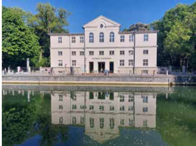
Alpines Museum München